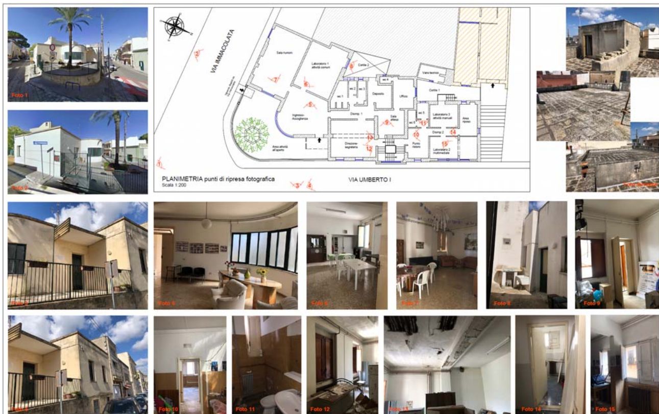
Stato dei luoghi - Documentazione fotografica