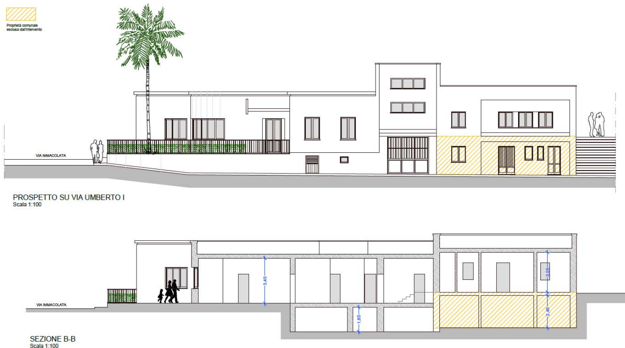
Prospetto e sezione di progetto

Gli interventi edili e impiantistici previsti sono i seguenti (per le forniture si rimanda alle apposite tavole di progetto):